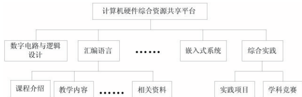
图2 资源共享平台结构图

当前虽然网络资源非常丰富,各种信息通过网络可以随时查阅,但体系完整的资源并非随处可得。在课程群建设中构建了一个统一的计算机硬件课程资源共享平台,平台基本结构如图2所示。平台中每门硬件课程一个系统模块,另外还包含一个综合实践模块,每个课程模块均包含课程介绍、教学内容、实验项目和相关资料几个部分;综合实践模块包含实践项目和学科竞赛2个部分。利用该