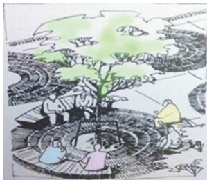
图1 具有凝聚力的向心性地面图案

第一,运用地面铺装的图案来对底界面进行设计。地面铺装的图案能够影响人的心理可以给人带来多种暗示的信息。地面铺装的图案可以分为有向性、向心性以及无向性等三种,有向性的图案