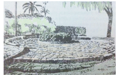
图2 粗犷的铺地质感

第三,利用地面铺装不同的纹理与质感来赋予底界面不同的气质。不规则的纹理可以赋予底界面活泼动感的气质,而规则的纹理则表现出良好的秩序性,带给人安详和稳定的感觉;粗糙的质感能够给底界面赋予粗犷、质朴以及自然的气质,给人安全和信赖的感觉,细腻的质感则表现出精致、典雅以及尊贵的气质,给人温馨甜蜜的感觉。