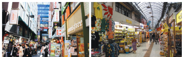
图3 开敞式的营业界面

第一,建立开敞式界面。城市商业街区常见的经营方式为前店后坊,出于营造商业气氛的目的,可以在局部一些地段将桌椅适当移出店面,在不影响通行的情况下,摆放在街面上,建立开敞式的营业界面,将所卖商品的种类和款式等第一眼信息传递给逛街的人流,尤其是在当地具有很大影响力的老牌名店采用开敞式布局,可以帮助激发游客的购物欲望,而且,相比于室内购物,室外购物不仅更为简便,还能享受到新鲜空气和阳光 [6] (图3)。