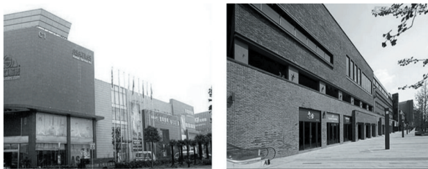
图5 玻璃材质在界面上的运用